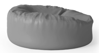
Pouf extra-large Boden 1BO1-200 56 H | 140 Ø (cm) Poids : 23 kg