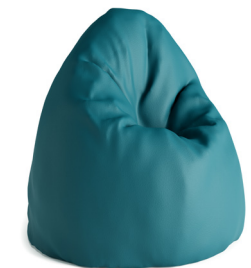
Pouf poire Boden - Teal 1BO1-100-A 80 H | 90 L | 90 l (cm) Poids : 13 kg