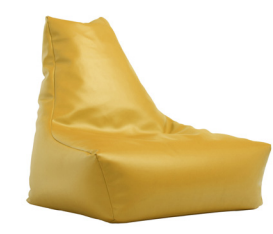
Pouf poire chaise Boden 1BOCHAIR1-100 90 H | 100 L | 105 l (cm) Poids : 13 kg