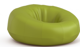
Pouf donut Boden 1BODONUT1-100 65 H | 135 Ø (cm) Poids : 27 kg

Rembourrage conçu avec 100% de matière recyclée