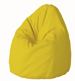
Pouf poire Boden 1BO1-100 80 H | 90 L | 90 l (cm) Poids : 13 kg