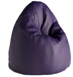
Pouf poire Boden - Violet 1BO1-100-A 800H | 900W | 900D (mm) Weight: 13kg

La gamme Boden Express est en stock pour vous assurer une livraison rapide