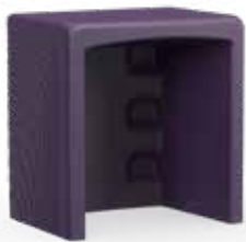
Bureau ouvert Code : ARYOD-001

73,5 H | 69,8 W | 50,7 D (cm) Poids : 15 kg