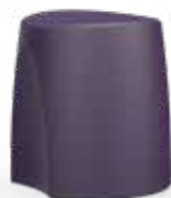
Tabouret Code : ARYS-50

Lesté 50 kg pour plus de sécurité, fixation au sol en option