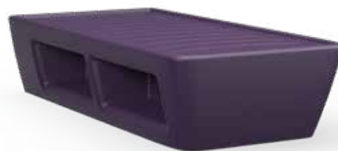
Lit avec rangement Code : ARYB-002