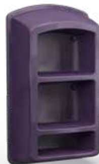
Étagère murale ouverte avec 3 compartiments Code : ARYOW-300

120 H | 69,9 W | 31,3 D (cm) Poids : 18 kg