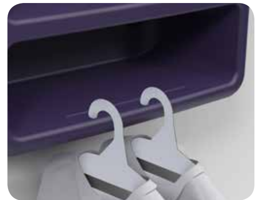
Solution innovante de suspension des vêtements pour minimiser les risques de strangulation