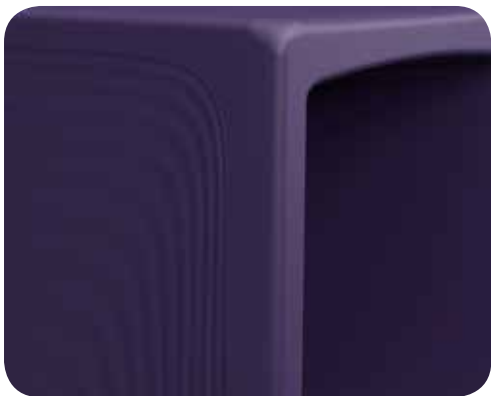
Courbes épurées pour créer un environnement propice au rétablissement