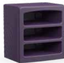
Commode ouverte avec 3 compartiments Code : ARYOC-300

73,5 H | 69,8 W | 50,7 D (cm) Poids : 15 kg