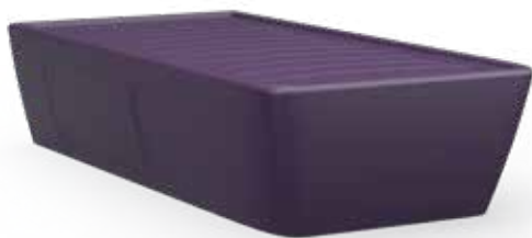
Lit Code : ARYB-001