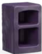
Table de chevet avec 2 compartiments Code : ARYOB-200

73,5 H | 69,8 W | 50,7 D (cm) Poids : 22 kg