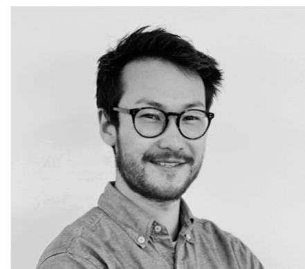
Conçu par Ross McLean

Pour beaucoup d'entre nous, un léger mouvement de balancement peut être une source de confort. C'est d'autant plus vrai pour ceux traversant une crise et se sentant perdre tout contrôle.