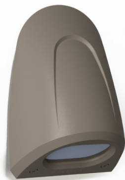
Lampe murale tactile Fynn 1FY230-WW-MG 17,5 H | 12 L | 10 l (cm)