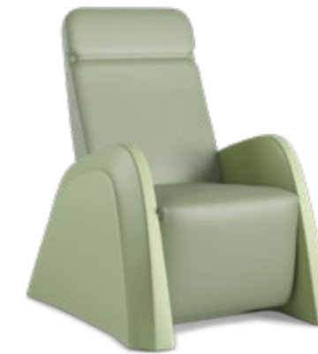
Fauteuil inclinable Levo Poids standard (90kg) : 1LV1-00

Dimensions position redressée : 122,9 H | 85,2 L | 128,3 P (cm)